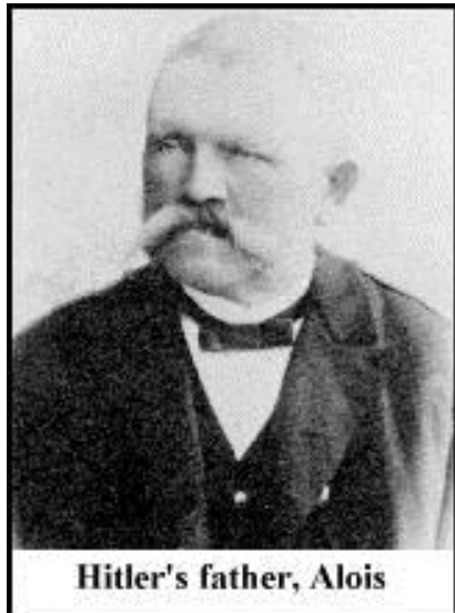
Hitler's father, Alois