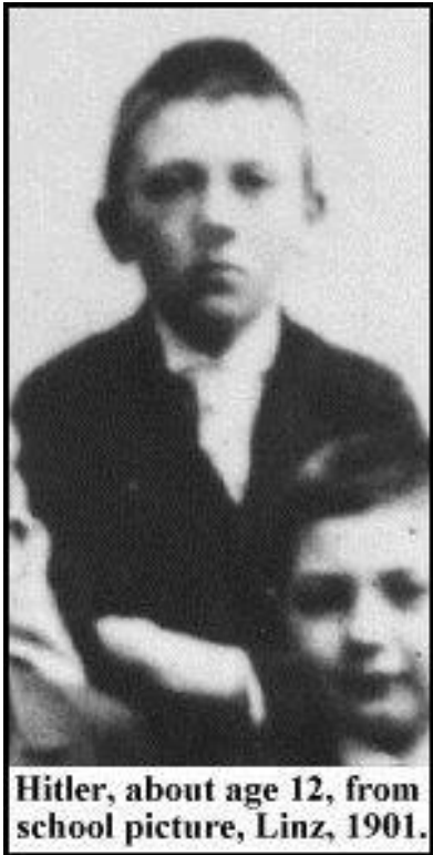
Hitler, about age 12, from school picture, Linz, 1901.