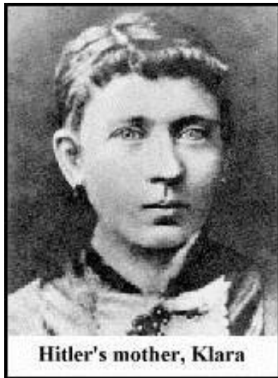
Hitler's mother, Klara